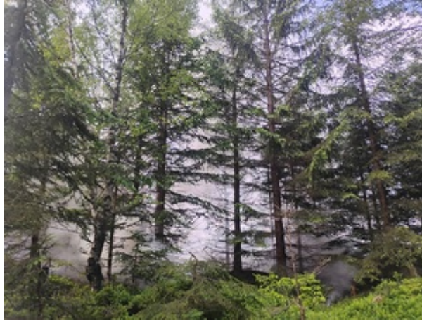
Wspólne działania służb podczas ćwiczeń ratowniczych S.A.F.E.