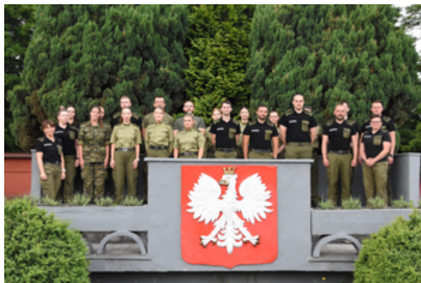
Kontrola legalności pobytu cudzoziemców na terytorium RP - II edycja