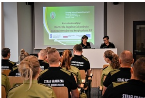
Kontrola legalności pobytu cudzoziemców na terytorium RP - II edycja