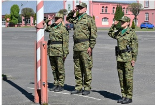
Dzień Flagi Rzeczypospolitej Polskiej