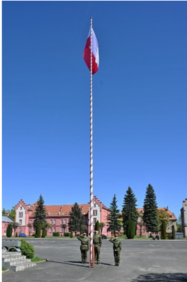
Dzień Flagi Rzeczypospolitej Polskiej