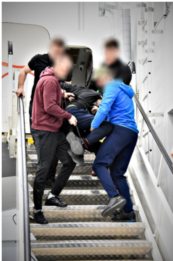
Przeprowadzanie doprowadzeń cudzoziemców drogą lotniczą - poziom I