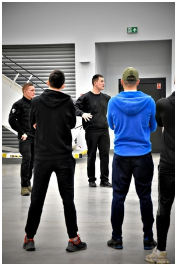
Przeprowadzanie doprowadzeń cudzoziemców drogą lotniczą - poziom I