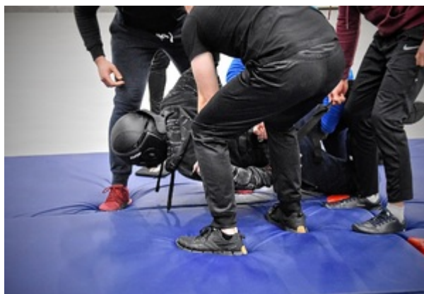
Przeprowadzanie doprowadzeń cudzoziemców drogą lotniczą - poziom I