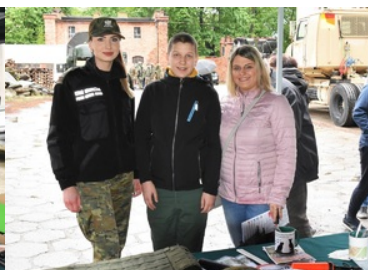
Funkcjonariuszka SG z kobietą i chłopcem przy stoisku promocyjnym SG