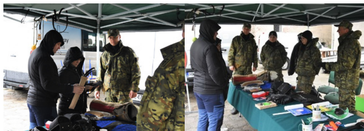
Kobieta i mężczyzna oraz dwóch funkcjonariuszy SG przy stoisku kynologicznym SG

Stoisko promocyjne, przygotowane w dniu 20.04.2024 r. przez funkcjonariuszy OSS SG w Lubaniu miało na celu promocję służby w Straży Granicznej wśród lokalnej społeczności oraz potencjalną rekrutację chętnych do wstąpienia w szeregi Straży Granicznej. Zaprezentowany przez nas sprzęt służbowy cieszył się dużym zainteresowaniem. Największą uwagę odwiedzających przyciągnęły psy służbowe, które razem z nami wzięły udział w pikniku. Uczestnicy zadawali mnóstwo pytań, związanych ze służbą naszych czworonożnych partnerów w Straży Granicznej. Każdy kto chciał, mógł przymierzyć kamizelkę kuloodporną, nałożyć hełm czy posiedzieć na quadzie, a nawet pogłaskać psa. Przedsięwzięcie było doskonałą okazją do tego, aby pokazać młodym ludziom, jakie możliwości dają służby mundurowe, i że warto związać swoją zawodową przyszłość m.in. ze Strażą Graniczną.