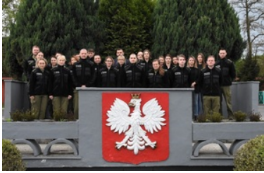
Zdjęcie grupowe funkcjonariuszy szkolenia na trybunie Ośrodka