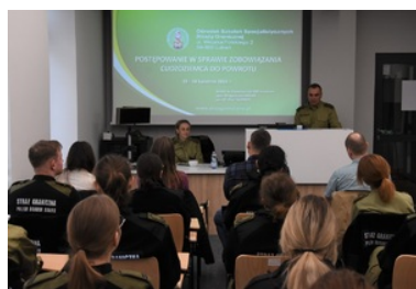
Dwóch wykładowców prowadzących zajęcia i funkcjonariusze przy stolikach. W tle tablica multimedialna.

W przedsięwzięciu wzięli udział funkcjonariusze z Nadwiślańskiego, Nadodrzańskiego, Morskiego, Nadbużańskiego, Warmińsko-Mazurskiego, Podlaskiego, Śląskiego, Bieszczadzkiego i Karpackiego Oddziału SG.