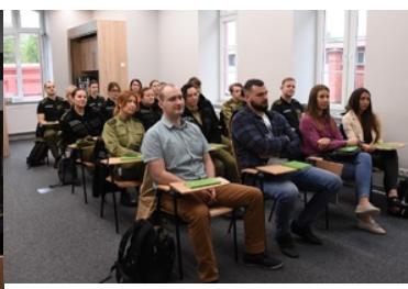
Funkcjonariusze w trakcie zajęć w sali wykładowej